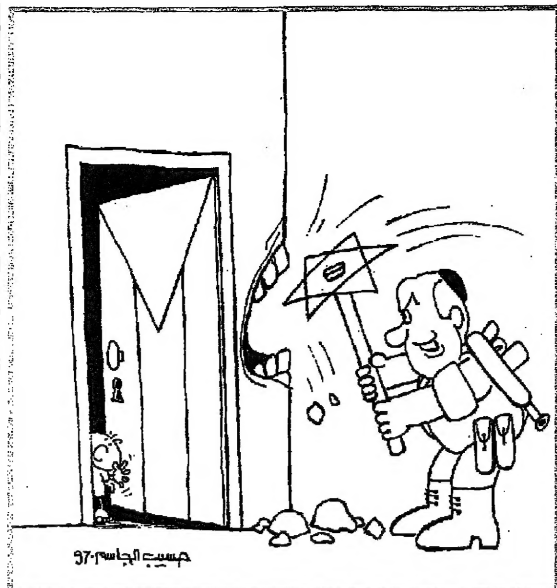
جسيد الجاسوس 97

وهذا ما يحدث الآن بالضبط بعد ثلاث سنوات من توقيع اتفاق إعلان الاستقلال في واشنطن وهي فترة لم تخل من تصريحات ثورية لعرضيه وإن كانت أكثر نضجاً مما كانت عليه في وقت سابق سنوات وذلك لخوضها من لهم التحسين والعملية ضد القيادة الفلسطينية.